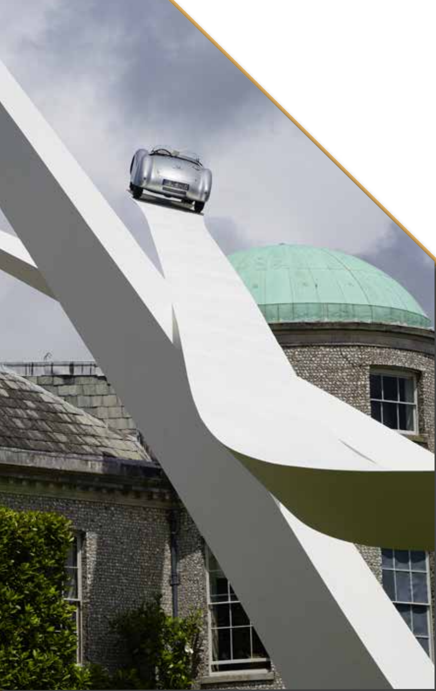
Foto van BMW op Goodwood, Festival of Speed